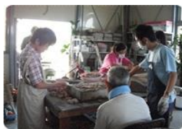
モザイクアート制作風景