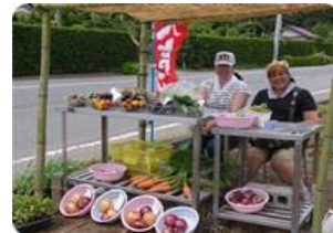
ふぁーむ 本納里 直売所