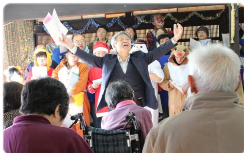
老人施設での訪問演奏

スペースぴあは1つ1つの実践を通して、地域のただ中で、福祉のあるべき姿を日々模索している非営利の運動体です。