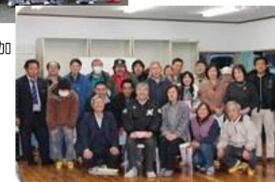
スペースぴあ交流会(ホール宗重)