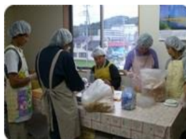
煎餅のリパック作業