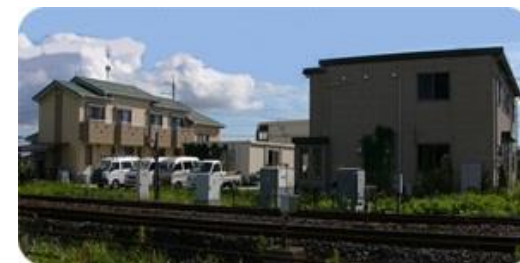
スペースぴあ貳番館 食堂 本部棟