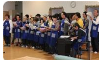
Space Peer Voice Ensemble