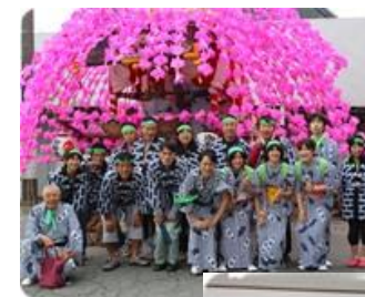
橘樹神社例祭参加