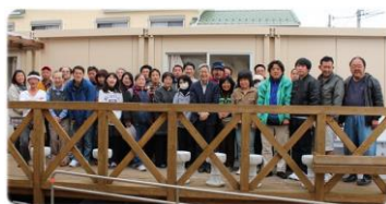
食堂のバルコニーにて