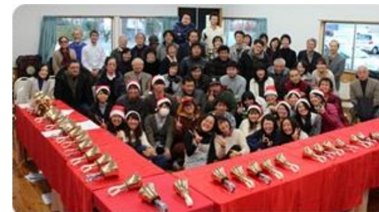
ハンドベルコンサート(ホール宗重)