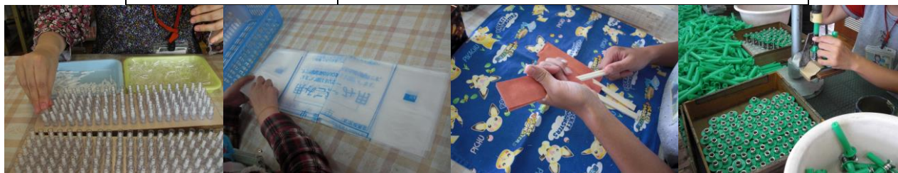
(ボールペン) (ゴミ袋の袋詰め) (箸の袋入れ) (建築部品の組立)