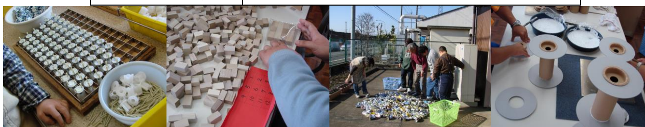
(建築部品の組立) (木工教材袋入れ) (アルミ缶リサイクル) (乾燥剤のリール)