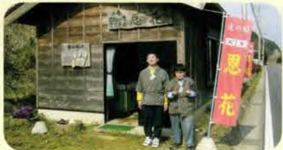
園直営売店「道の脇・恩花」