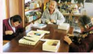
高齢となってもやるべきことのある暮らし