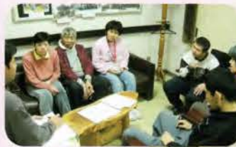
職員朝礼。 村を代表して 発言をする。

毎週土曜日午後村人公開の村議会を開催。ここでの議決は基本的に最優先で尊重されることになっている。