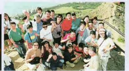
1999.1.31~24 ハワイ・ダイヤモンドヘッド 山頂に立つ