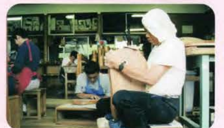
木工・花台を「磨く」