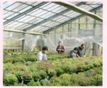
園芸・花を「育てる」