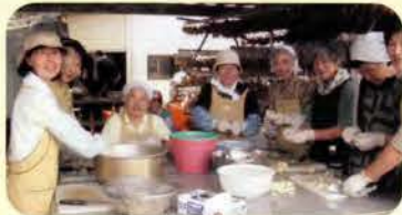
農耕班・らっきょう加工ボランティア (東庄町・秀の会) (年間延総数500名の方が作業ボランティアとして来て下さる。)