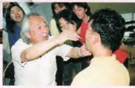
可能性への闘い言語治療