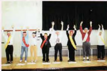
バンザイ！当選を喜ぶ 村長・村議員