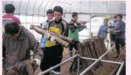
林産・椎茸の原木を「運ぶ」