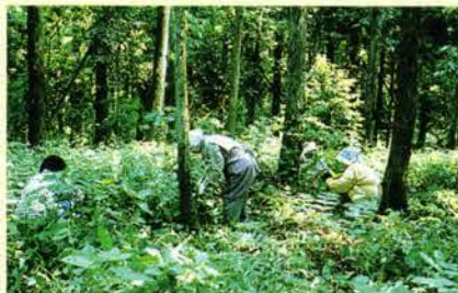
「親実習」我が子を支え、 共に歩む白髪のちはは — 山に分け入ってのドクダミ採り —