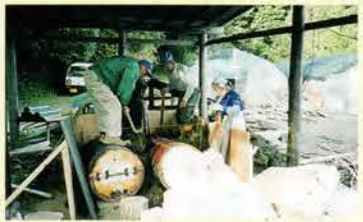
'00, 11月。地域ボランティアの 方が竹炭釜を作ってくれた。