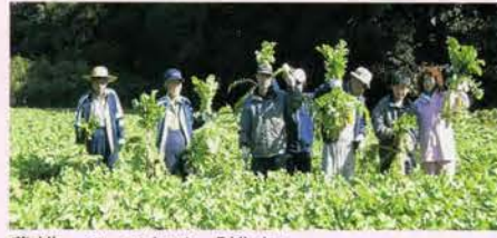
農耕・2haの畑を「耕す」