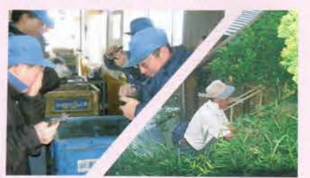
地域で「働く」汗を流して「働く」