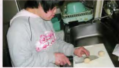
上手に切れるかな？料理特訓

食事はセルフサービスによる選択食。今日は天ぷらとエビチリソース。どっちがおいしそうかな、迷ってしまう。