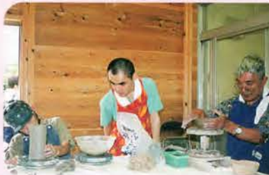
陶芸・壺を「作る」邪魔する