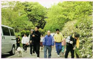
一日の計は元氣よく朝の散歩から