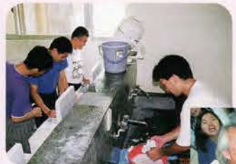
自分の物は自分の手で。毎日の洗濯