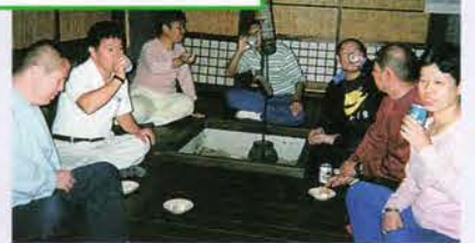
自主運営の居酒屋「礼舎」