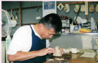
紙工芸・干支を「張る」