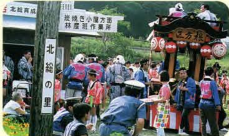
7月、今年も根方区の山車が北総の里に来てくれた。