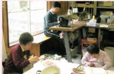
手芸・袋物を「縫う」