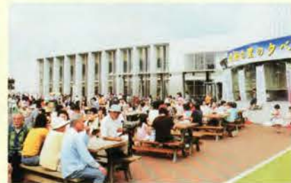
北総の里の夕べ。夏の地域の名物行事 (東庄町役場前広場)