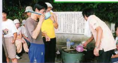
運動クラブの散歩。岡飯田の名水でちょっと休憩