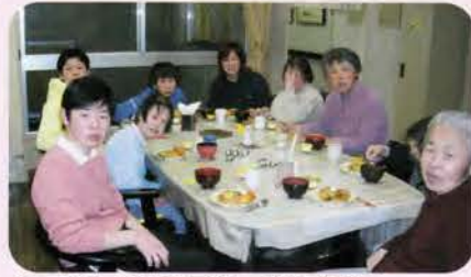
キッチンのある居室・菜の花寮