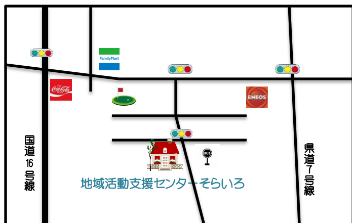
電建第一住宅バス停そば