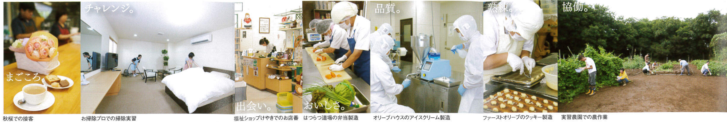
秋桜での接客 お掃除プロでの掃除実習 福祉ショップけやきでのお店番 はつらつ道場の弁当製造 オリーブハウスのアイスクリーム製造 ファーストオリーブのクッキー製造 実習農園での農作業