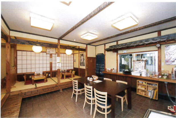
レストラン 花まんま

レストランでの接客、お総菜作り、ビーズアクセサリーの製造等、クリエイティブな作業を行っています。