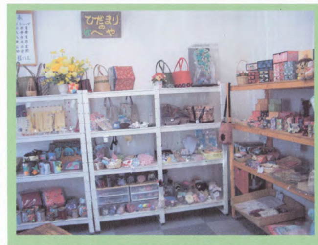
<レンタルボックスコーナー>