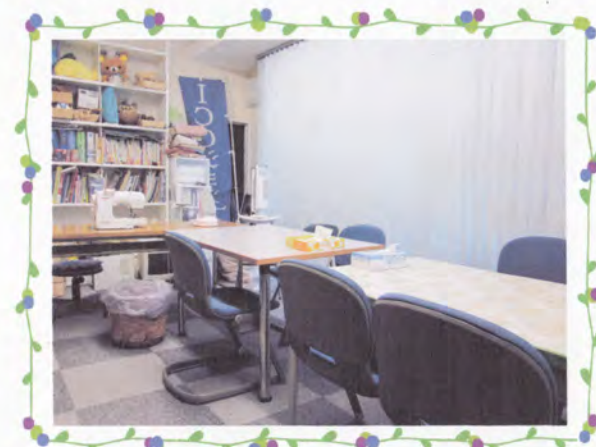
<日中活動／作業スペース>