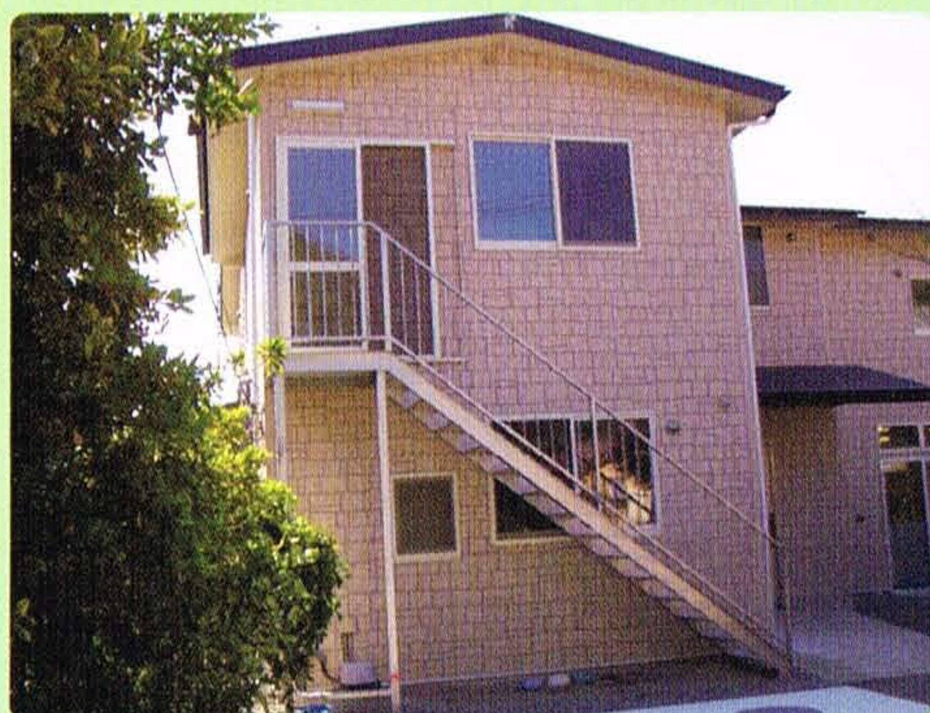
特定非営利活動法人 生活自立研究会