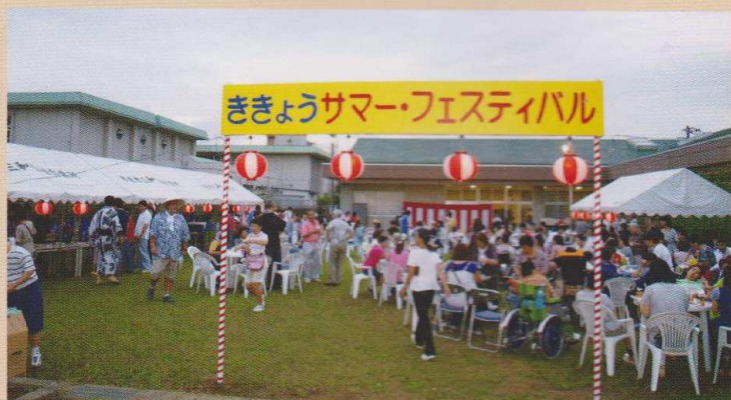
▲ききょうサマーフェスティバル