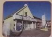
統括事務所は、地域生活支援の相談室と憩いの場