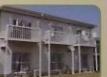
グループホーム・ケアホームの一部の外観：平成24年1月現在28カ所