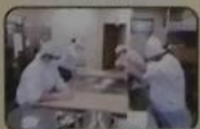
石炭(バン「然」ZEN)での作業場面