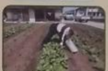
カンパニー安心食材農場