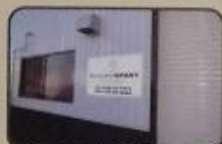
着 板 (入口)