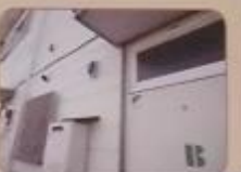
全てのGHI・CHIは、賛同会社と契約しています