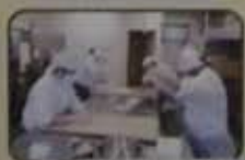
石炭パン(惣)【Z(N)】での作業場面