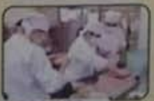
ご家族との通訳対談