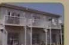
グループホーム・ケアホームの一部の外観・平成24年1月現在28カ所