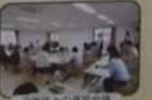
ご家族との通訳対談