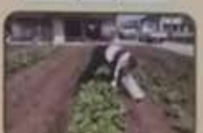
カンパニー安心野菜農園