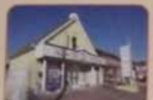
統括事務所は、地域生活支援の相談室と憩いの場