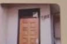
全てのGH・CHは、警備会社と契約しています