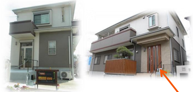
外観 ※ごぶごぶの入り口は写真右側の玄関です

「ごぶごぶ」という愛称には、支援する側される側のような枠をつくらず、“五分と五分”の関係を大切にしたいという思いを込めて名付けました。