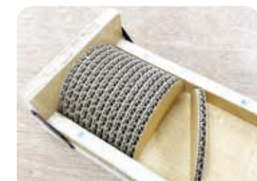
猫の爪とぎの製作