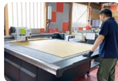
カッティングマシンの操作