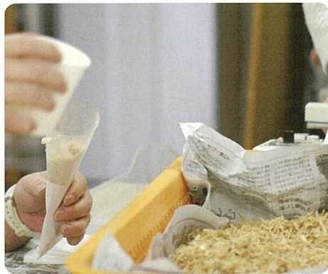
能登ヒバ・ひのきチップの作成