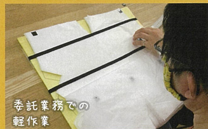
委託業務での軽作業